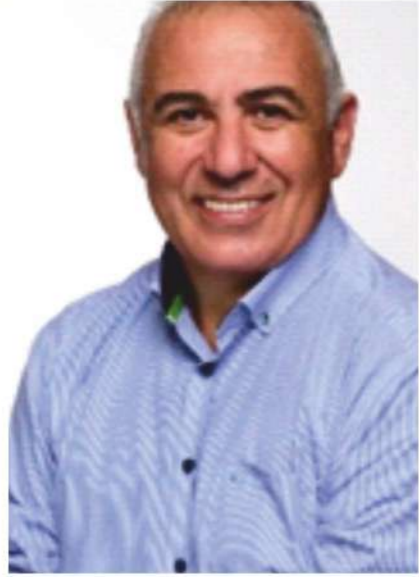
Δήμαρχος Αιγιαλείας ΠΑΝΑΓΙΩΤΗΣ ΑΝΔΡΙΟΠΟΥΛΟΣ