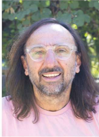
Αντιδήμαρχος Πολιτισμού Αθλητισμού και Διαχείρισης Αδέσποτων Ζώων